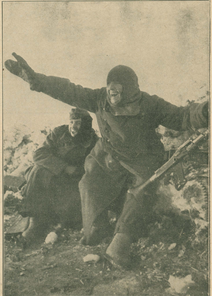
„1:0 gewonnen! Da geht der erste hoch! . . .“

Stundenlang schon sind die beiden mit ihrem MG. in Stellung hinter der Brustwehr aus Eis und Schnee. Ein paar bolschewistische Panzer sind in der Flanke durchgebrochen und versuchen, von hinten her die deutschen Stellungen zu überrennen. Da bellen deutsche Pakgeschütze auf und . . .