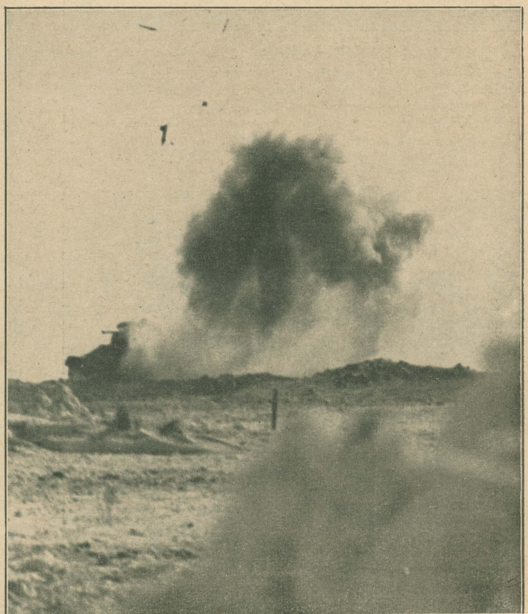
. . . wenige Sekunden später wirbeln Panzerteile durch die Luft, steht eine Explosionswolke über der Stelle, an der der erste Panzer einen Volltreffer in seine Munitionskammer erhielt!

Stundenlang schon sind die beiden mit ihrem MG. in Stellung hinter der Brustwehr aus Eis und Schnee. Ein paar bolschewistische Panzer sind in der Flanke durchgebrochen und versuchen, von hinten her die deutschen Stellungen zu überrennen. Da bellen deutsche Pakgeschütze auf und . . .